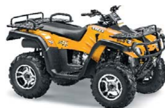
STELS ATV 300 B