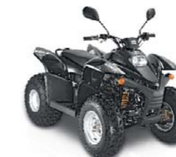
STELS ATV 100 RS